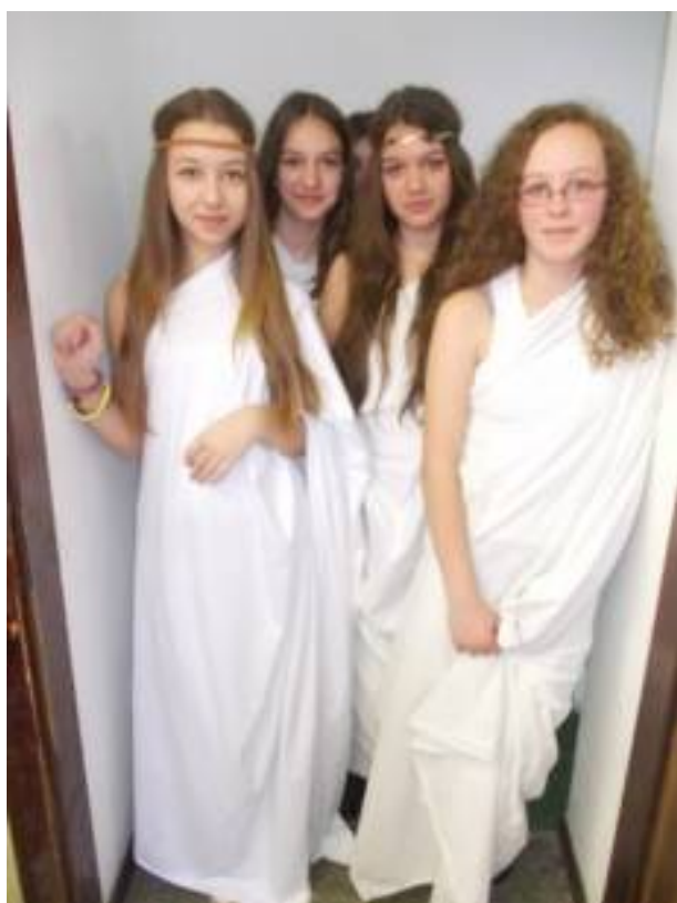
Λεπτιτζε из антике