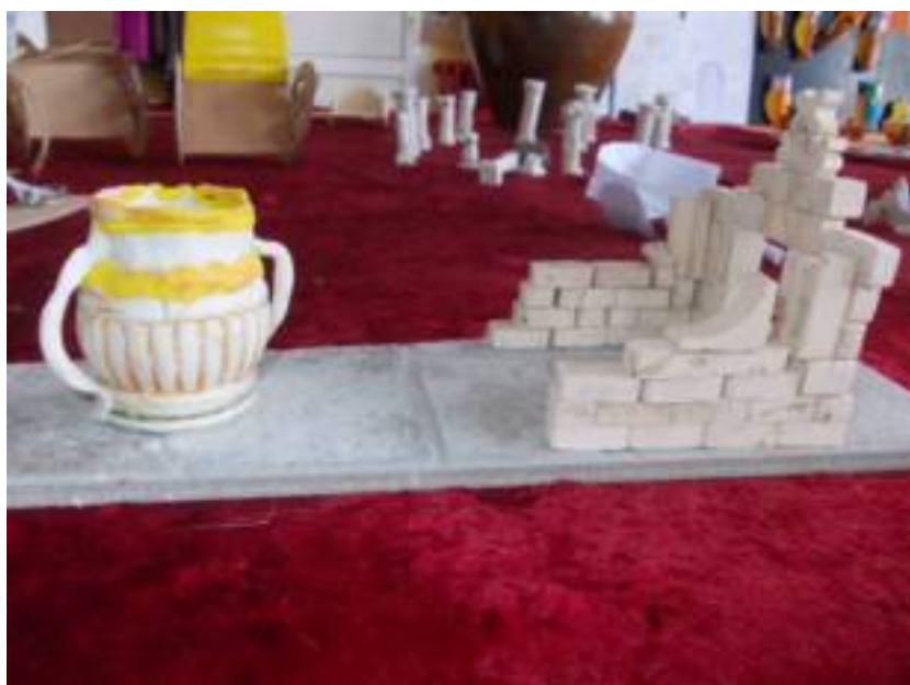
Ραλ μαϋκε ηασηη Σαμαρϋηηα. Βεληκο ηβαλα!