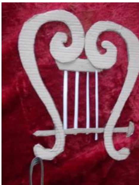
Λιρα,πριχα ο Ορφεϋ η Εϋριδικη,4.ραζρελ