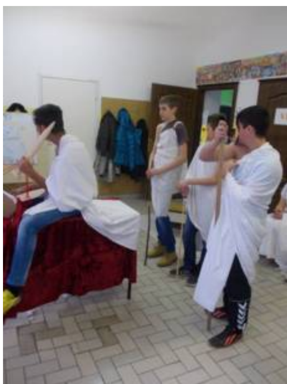
Амфитеатар, развој позоришта