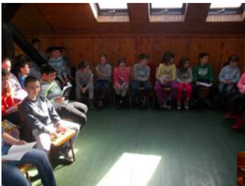
Ученици нижих разреда - Дискусија на тему "Шта знам о Старој Грчкој"