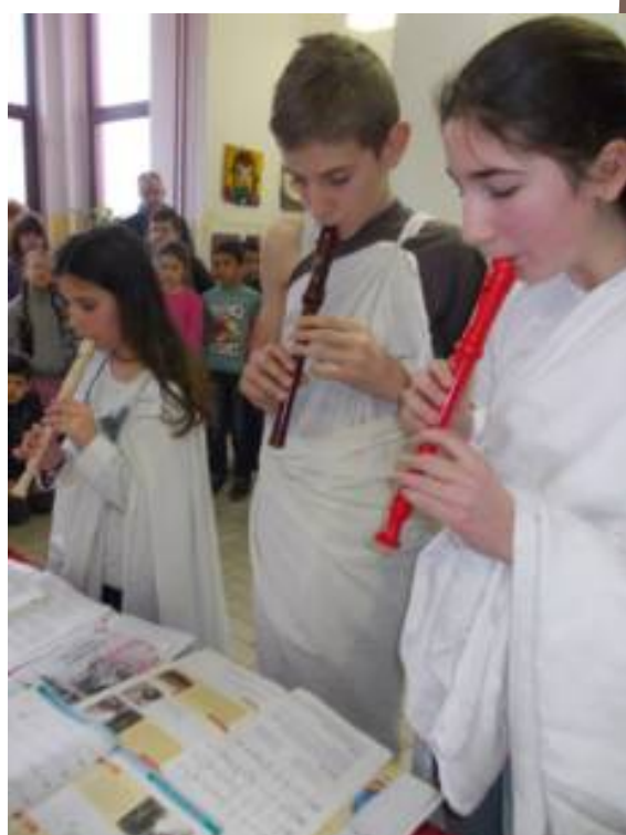
Надметање у свирању је било популарно у антици