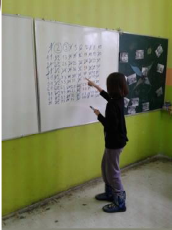
Ерасотеново сито, 5. разред