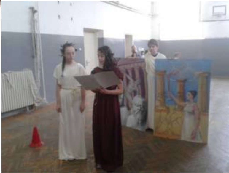
Отварање Олимпијских игара