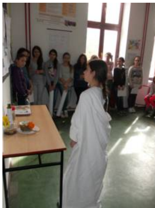
Ученице 7.разреда са наставником историје