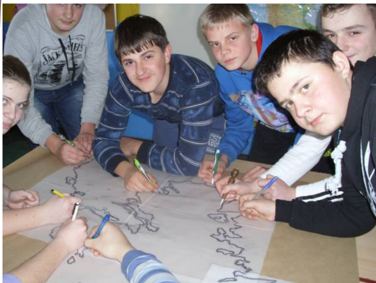
Цртање географске карте