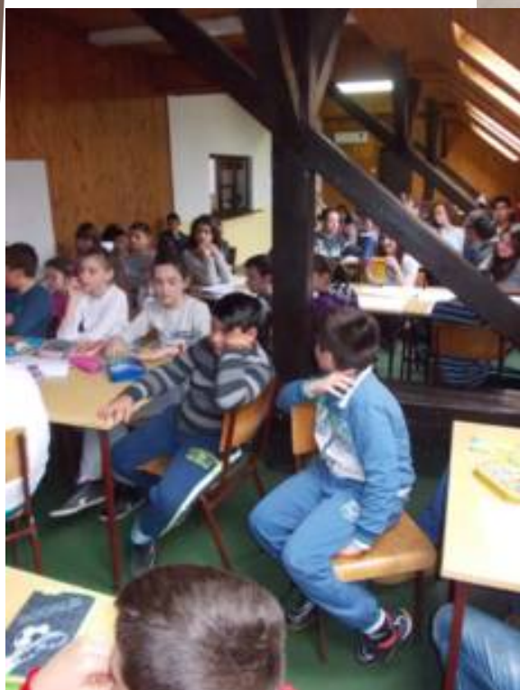
Ликовна радioniца "Грчки богови"