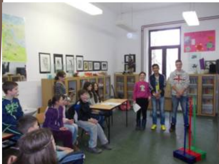
Παρουσίαση γρηγορίων μαθηματικά, 5.-8. τάξη