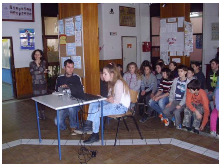
Приказ песама грчких уметника