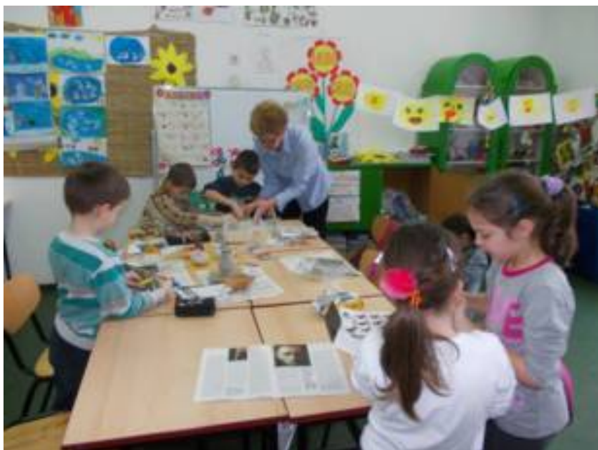
Предмети из антике,1.разред