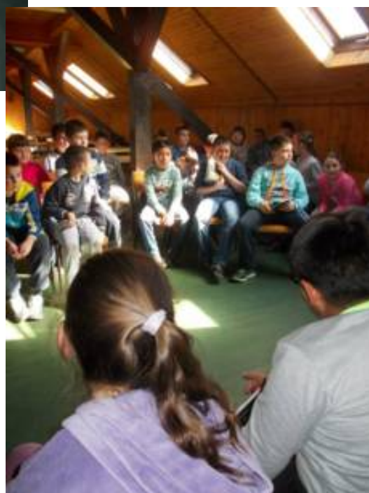
Бацање у даљ је стара спортска дисциплина