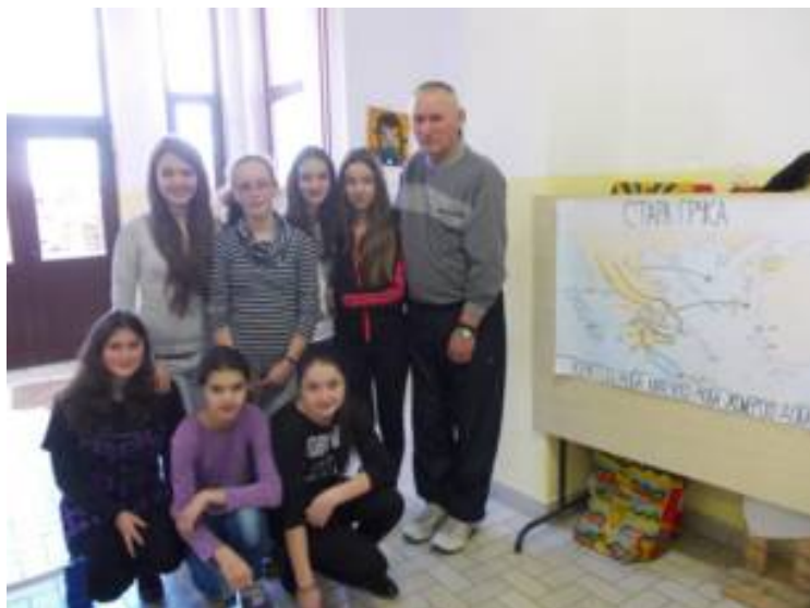
Ученице 7.разреда са наставником историје