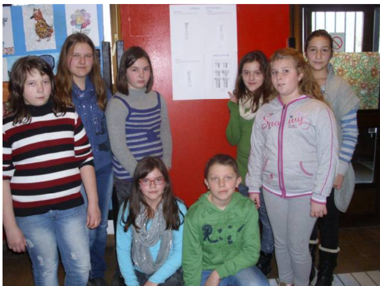
Γρчки студови (ТИО)