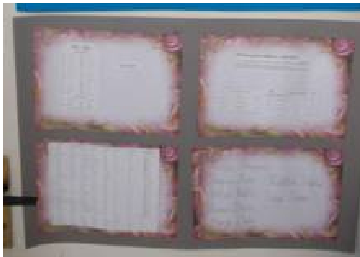
Γрчки алφαдет и енглески језик