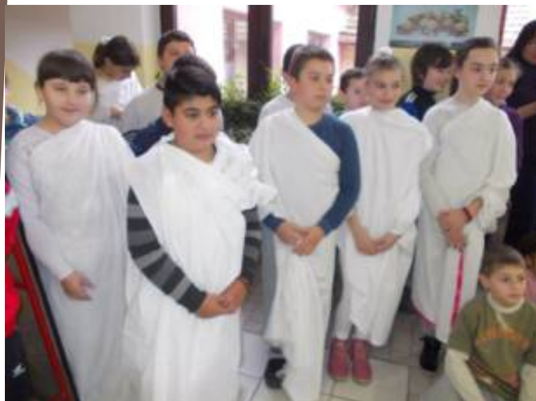
Грци у 4.разреду