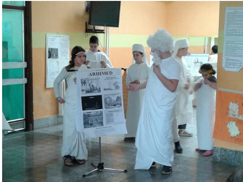
Старогрчки математичари Архимед