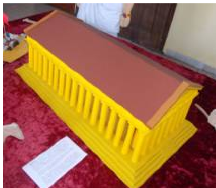
Партеион. Макегу израдио Луѓиша Шујица и велико му хвала на овом либном поклону!