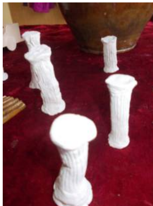
Стубови од глинамола,дорски,јонски и коринтски,6.разред