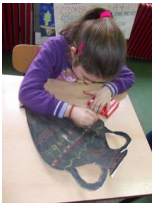
Γρηγορίων, 3. τάξη