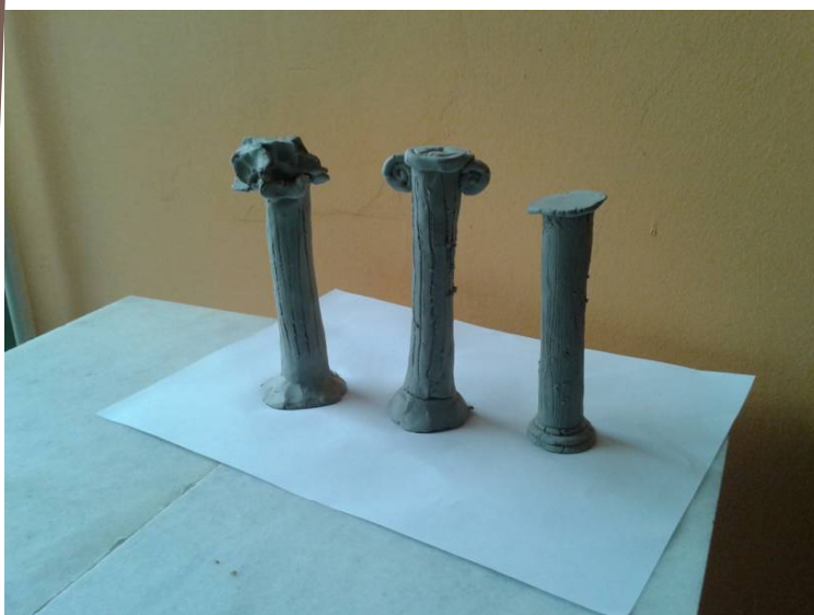
Дорски, јонски и Коринтски стуб ТИО, 6. разред