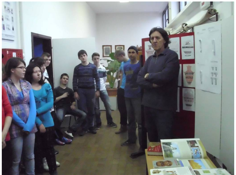
Παρουσίαση ελληνικής τέχνης