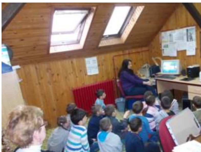
Анимирани филм "Δεдал и Икар", 1. и 2. разред