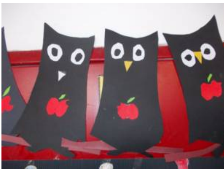
Софе, симбол догиње Атине, 4.разред