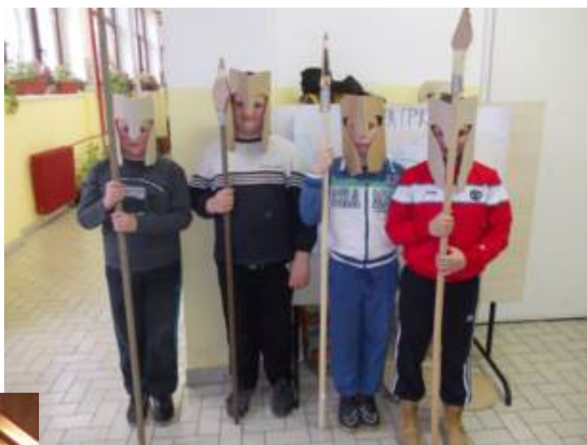
Старогрчки ратници, 4. разред